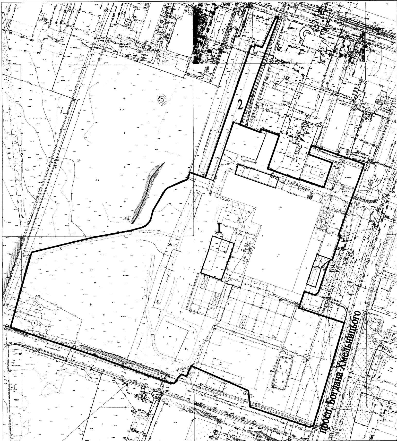
Графічний матеріал з позначенням місцем розташування земельної ділянки, її розміром та площею М 1:2000